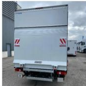
Achter sluitende laadklep