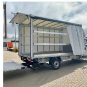
Schuifzeilen links en/of rechts