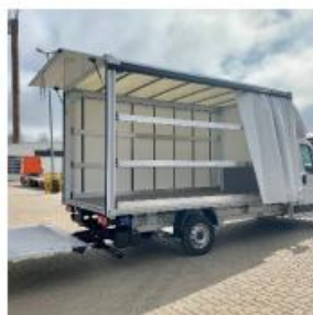
Schuifzeilen links en/of rechts