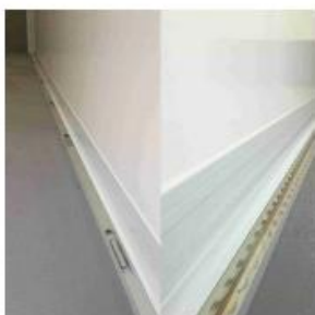
Sjorogen in de vloer