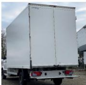
Achterdeuren met opstap