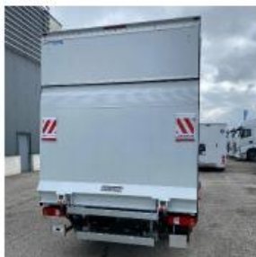
Achter sluitende laadklep